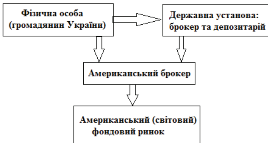
Рис. 2. Схема доступу фізичної особи до американського фондового ринку

Ми пропонуємо в якості такої підтримки створення державної брокерської установи, яка одночасно виступала б також в ролі депозитарію, однак за суттю – субброкером, який би надавав фізичним особам – громадянам України доступ до американського фондового ринку (рис.2).