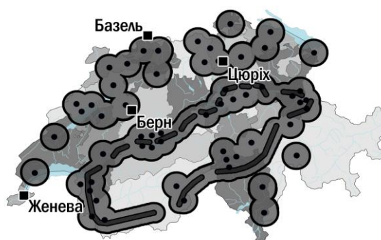
Рисунок 1 – Розташування укріплень Національного Редуту та ключові міста Швейцарської конфедерації. Кружечками позначені самостійні фортифікаційні споруди, сірими лініями – менші за розміром комплексні укріплення. Світло-сірі, обведені чорним контуром області – приблизний радіус дії озброєння, що використовувалось у редутах.

Відомо, що згадані укріплення оснащувались як автоматичною зброєю дрібних калібрів, так і артилерійськими гарматами калібром від 24 до 150 міліметрів. Зокрема, найбільша з тих, що встановлювались у редутах, гармата – 150-mm Vofors Kanone – мала дальність ураження більше 20 кілометрів. Приблизне розташування та, виходячи з нього, радіус дії укріплень, наведені у нашому рисунку 1.