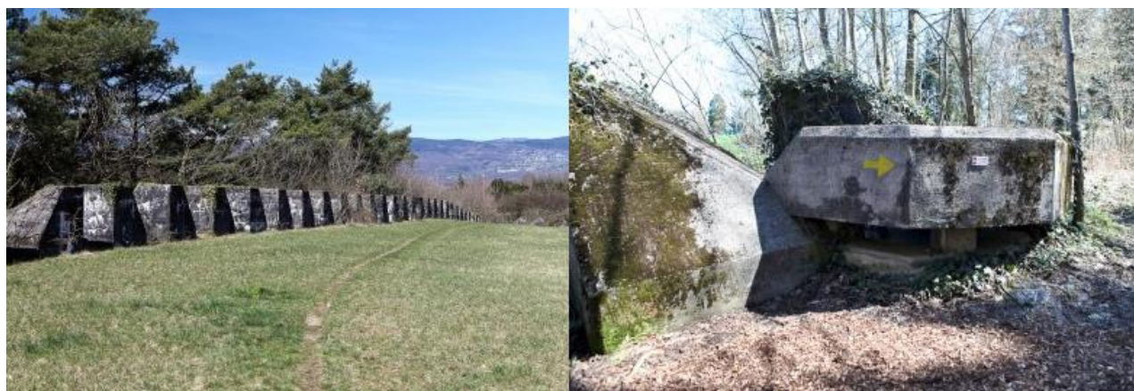
Рисунок 2 – «лінія Тоблеронів» та її «вогневі точки»

Щоб відбити можливу атаку з води, лінія вдавалася в озеро на 50 метрів. Всього в ній близько 2700 бетонних блоків, кожен вагою дев'ять тонн. Сторона, повернена в сторону атаки, є зрубаною під кутом, щоб танк на неї заїхав і «завис». Блоки і укріплення стоять чітко вздовж природної перешкоди – гірської річки. А по інший бік – поле, що повністю прострілюється. Укріплення були передбачені і на самій лінії (рисунок 2). Найвідоміша фортеця «лінії Тоблеронів» – «Рожева вілла» (Villa Rose), підтримувалася в бойовій готовності майже до сьогодні [21]. На перший погляд, це – звичайний будинок, що стоїть в тіні дерев уздовж регіональної дороги. Але у 1940-і рр. в будинку постійно знаходився загін солдатів, готових до атаки. За сигналом тривоги «двері» відкривалися, і за ними було кілька протитанкових гармат, схованих за стінами завтовшки два з половиною метри (рисунок 3).