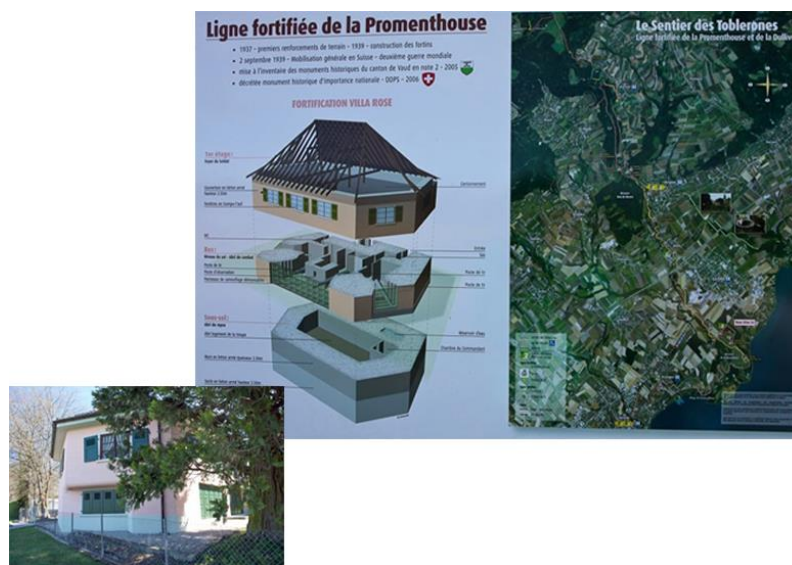
Рисунок 3 – Артилерійська позиція «Рожева вілла» - вид ззовні та схема будівлі. Вікна та віконниці на будинку намальовані. Супутниковий знімок «лінії Тоблеронів».

(за матеріалами http://telegrafua.com/social/14065/print/ )