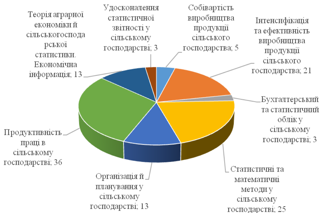
Рисунок 2. Структура предмета досліджень О. А. Бугуцького за напрямками на етапі «Підйому» ЖЦНД (1962–1972 рр.), кількість

Аналіз наукової діяльності О. А. Бугуцького за період з 1962 по 1972 рр. засвідчує об'єкт його наукових досліджень – економічні та статистичні проблеми в галузі сільського господарства. Більш предметно: 30,3 % наукових досліджень присвячені питанням продуктивності праці, 21,0 % – статистичним методам, 17,6 % – притаманні проблеми ефективності та інтенсифікації виробництва продукції сільського господарства й 31,1 % – інші питання.