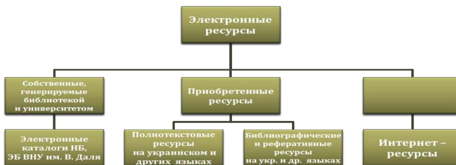
Рис. 1. Структура электронных ресурсов НБ ВНУ им. В.Даля

приобретаемых, генерируемых библиотекой, а также ресурсов сети Интернет. Структура электронных ресурсов НБ ВНУ им. В.Даля представлена на рисунке 1.