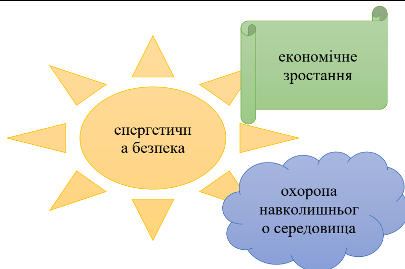
Рисунок 2. Конфігурація Trilemma

Світове споживання первинної енергії становить 10 млрд тонн еквівалента сирої нафти на рік, і, як наслідок, величезний обсяг / Викиди CO 2 починають завдавати серйозної шкоди навколишньому середовищу такі проблеми, як глобальне потепління. Якщо ми, громадяни с передові країни, продовжують насолоджуватися комфортним життям залежно від такого масового споживання енергії, а якщо демографічний вибух і економічний розвиток прогресує в країнах, що розвиваються, які займають 85% загальної кількості населення світу, гостра нестача їжі, вода і природні ресурси стануть реальністю, і наше глобальне середовище зіткнеться з дуже серйозною ситуацією. Розвиток технологій для подолання цих видів труднощі є, по суті, головним пріоритетом питань.