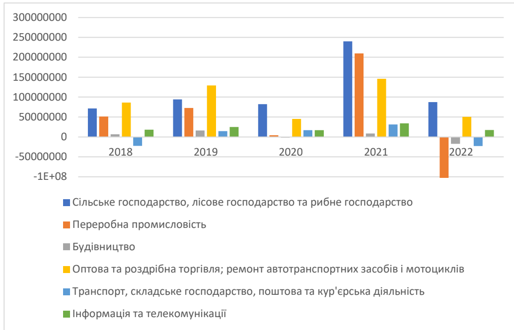
Рис. 3. Фінансові результати суб'єктів господарювання за видами економічної діяльності