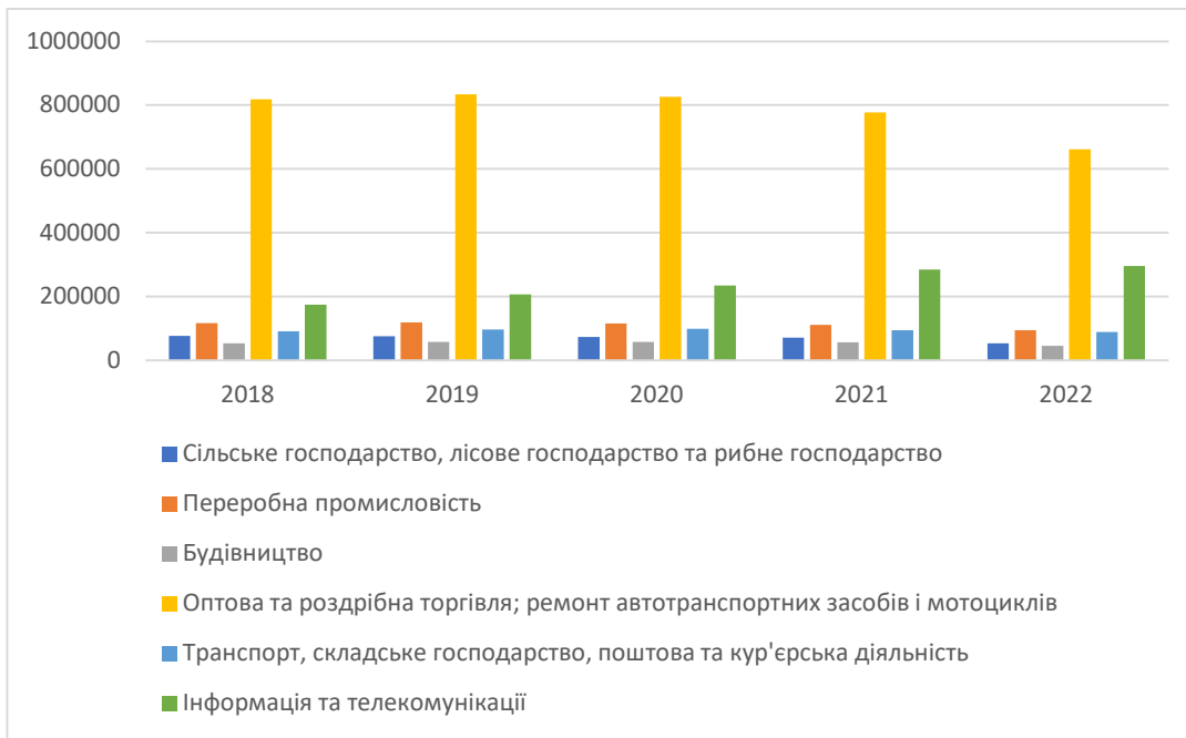
Рис. 1. Кількість діючих суб'єктів господарювання за видами економічної діяльності