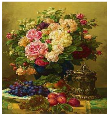
Репродукція картини Ж.-Б. Робі

Інтерес з боку студентів викликає виконання творчого завдання «Я представляю себе квіткою». Після прослуховування музичного твору П. І. Чайковського «Вальс квітів», студенти діляться своїми враженнями та емоціями і залучаються до пошуку і відбору картин художників, на яких зображені квіти (наприклад, картини Ігоря Левашова, Жана-