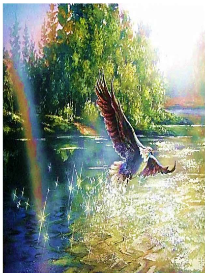
Репродукція картини С. Ковальчук