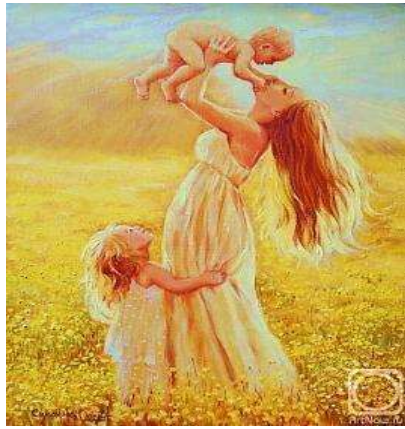
Репродукція картини О. Симонової «Щастя»