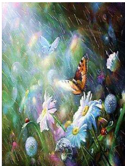
Репродукція картини О. Желонкіна