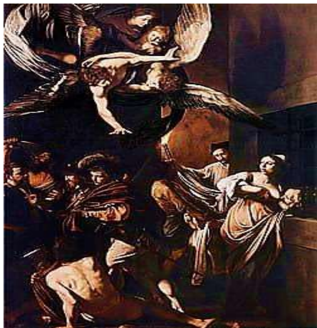
Репродукція картини М. да Караваджо «Сім діянь милосердя»