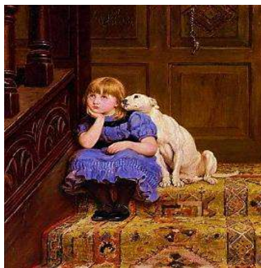
Репродукція картини Б. Рів'єра «Співчуття»