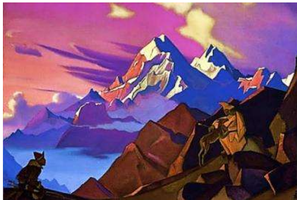
Репродукція картини М.Реріха «Співстраждання»