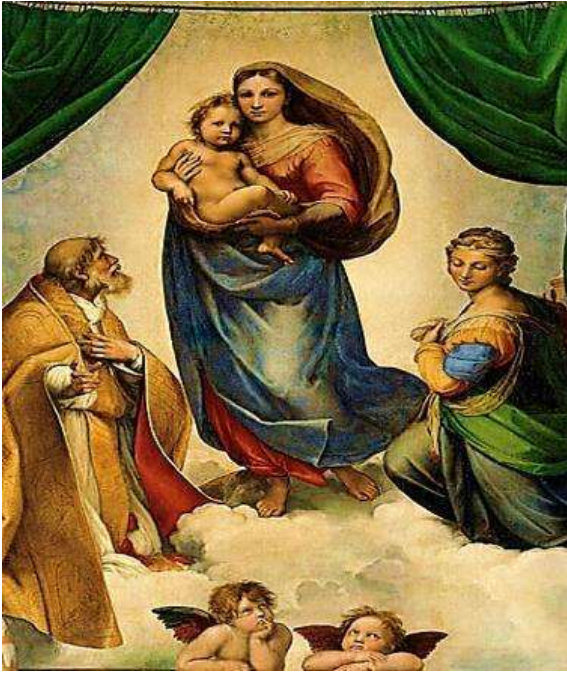
Репродукція картини Р. Санті «Сікстинська Мадонна»