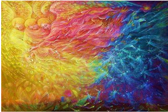
Репродукція картини А. Павлової «Пробудження»