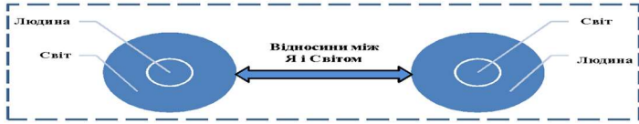
Рис. Онтологія життєвого світу людини

Ця концепція має дві сторони. Перша – людина в світі – засвідчує, що людина є невід’ємною складовою об’єктивного світу. Актуальність проблеми в тім, що з виникненням віртуального простору людина все більше відчужується від життя, втрачає реальну ідентичність. Друга сторона – світ в людині – визначає внутрішній вимір буття людини, тобто кожна людина завдяки своїй внутрішній духовності репрезентує світ. Проблема полягає в спотвореному сприйнятті дійсності людиною з причини втрати духовних орієнтирів – найвищих життєвих цінностей, смислів та ідеалів. 366