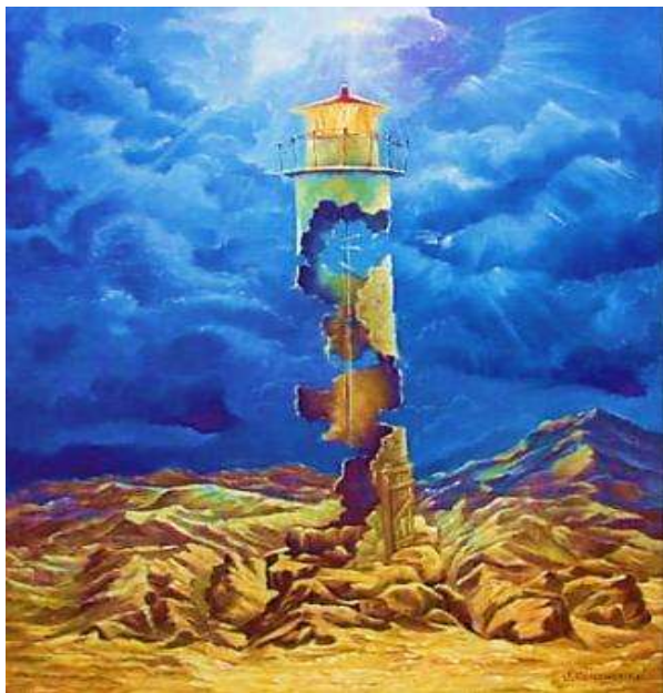
Репродукція картини С. Пишненко «Поки жива надія»