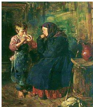
Репродукція картини В. Маковського «Побачення»