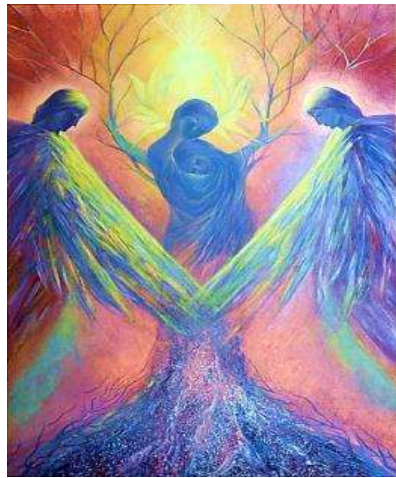
Репродукція картини Л. Хіміч «Любов»