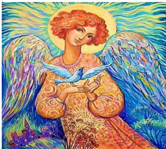
Репродукція картини А. Остроумової «Голуб миру»

Я маю в серці мрію щирю: Хай тихо стане в нас від миру, І буде тихе щастя скрізь Без криків, пострілів і сліз. Нам разом в мирі жити треба – Одна земля й одне в нас небо! Одна зима, одне і літо – Нам разом в мирі треба жити! Країни рідної сини, Хоч різні в нас думки і сни. І різні сльози й різний сміх, Та мрія є одна на всіх. Хоч різні ми, але так схожі, Бо кожен, кожен з нас не може Без миру в Україні жити, Де мирне небо й мирне жито. Без мирних справ і мирних слів,