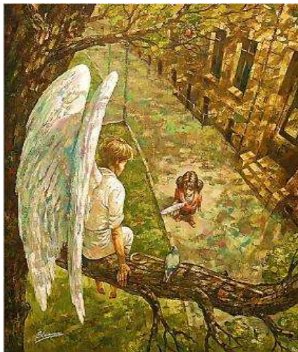
Репродукція картини В.Калініна «Четвер. Після дощу»