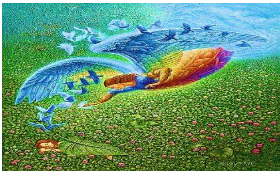
Репродукція картини В. Миколайчука «Пробудження»