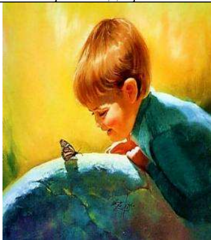
Репродукція картини Д. Золана