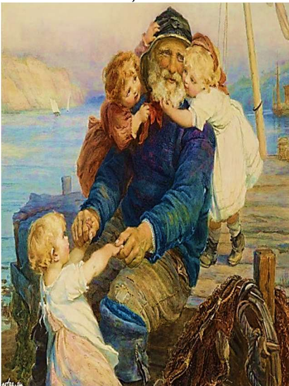
Репродукція картини Ф. Моргана