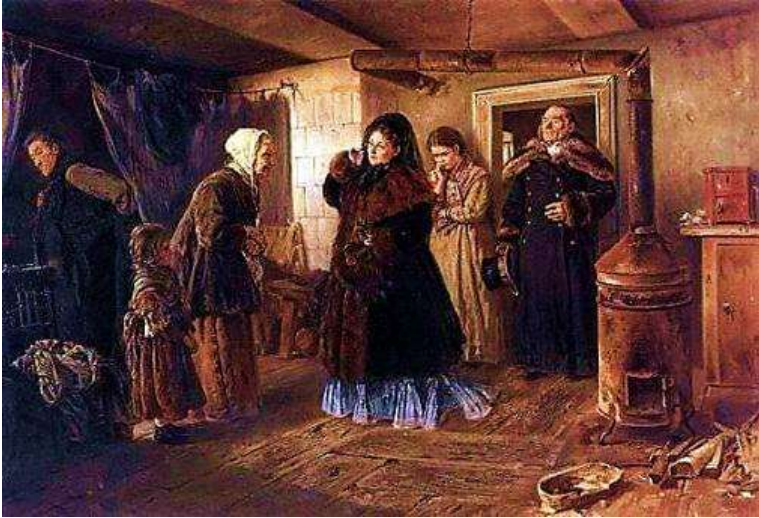
Репродукція картини В. Маковський «Відвідування бідних»