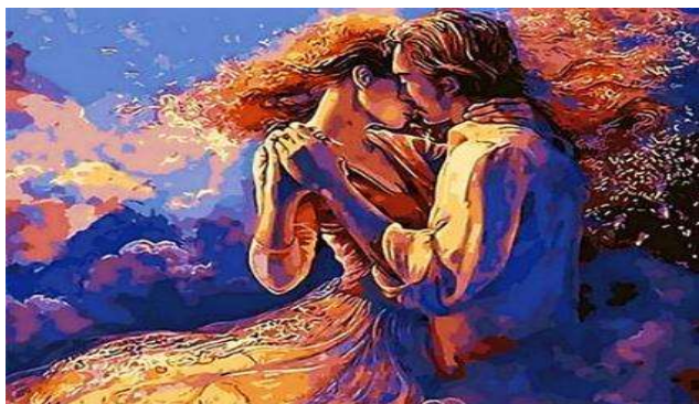
Репродукція картини Ж. Уолл «Любов і сон»