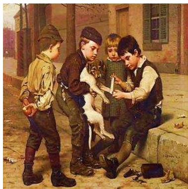
Репродукція картини Дж. Брауна