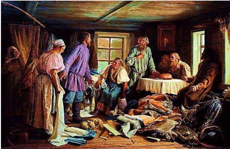
Репродукція картини В. Максимов «Сімейний розділ»