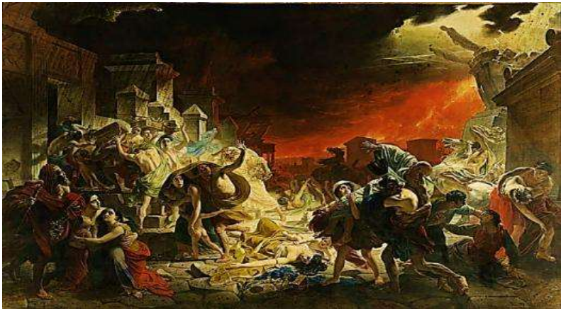
Репродукція картини К. Брюллов «Останній день Помпеї»