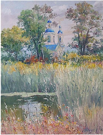
Репродукція картини Т. Стегереску «Благодать»