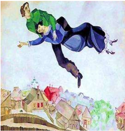
Репродукція картини М. Шагала «На сьомому небі від щастя»