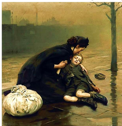
Репродукція картини Т. Б. Кенінгтона