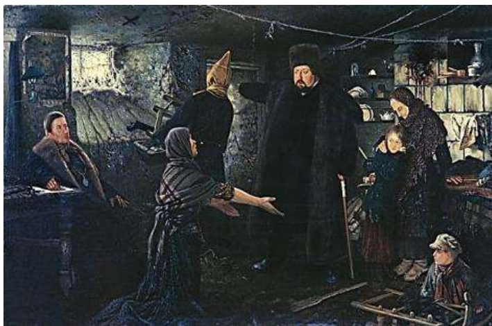
Репродукція картини П. Яковлева «Право сильного»