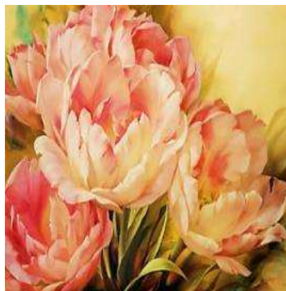
Репродукції картин Ігоря Левашова