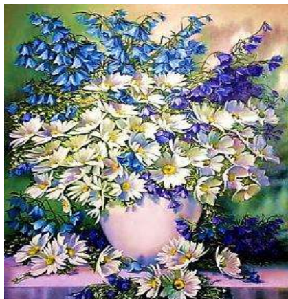
Репродукції картини Ж. Когай