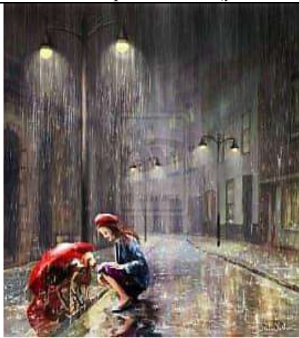
Репродукція картини Е.Альтун «Доброта»