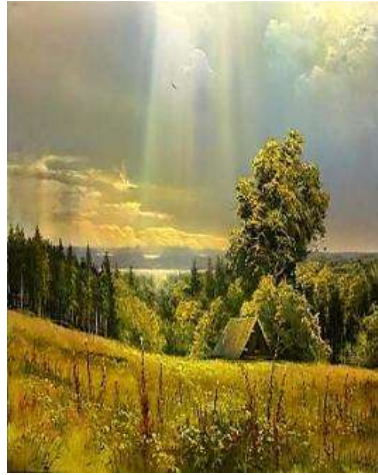
Репродукція картини В.Юшкевича «Перед дощем»