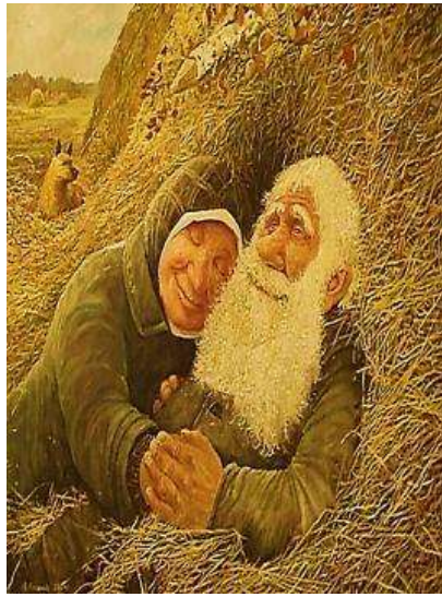
Репродукція картини Л. Баранова «Щастя»