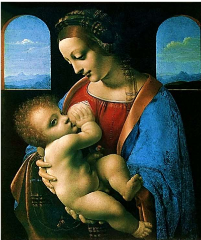
Репродукція картини Л. да Вінчі «Мадонна з немовлям»