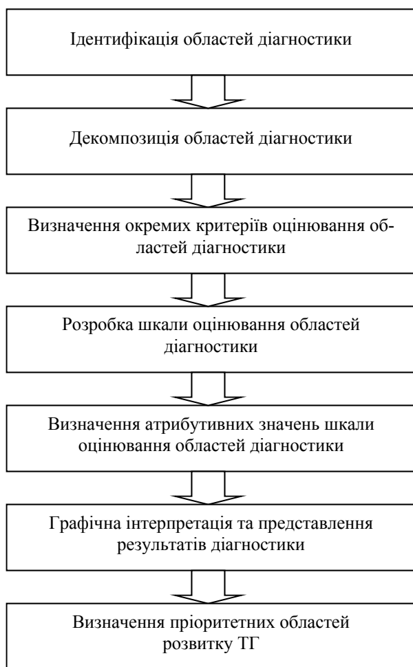
Рис. 2. Методика діагностики розвитку територіальних громад як організаційно-економічної системи

жним співробітником свого місця в реалізації стратегії таких змін в діяльності органів управління, служби або функціонального підрозділу. Тому важливо забезпечити просту та зрозумілу для кожного співробітника форму представлення результатів та напрямів необхідних організаційних змін. Для цього пропонується застосовувати узагальнюючі таблиці та графічне представлення результатів аналізу та оцінювання з подальшою діагностикою (віднесення області до певного характерного діапазону значень). Визначені таким способом області (критерії або групи критеріїв) будуть демонструвати ті напрями необхідних позитивних впроваджень, на яких слід зосередити увагу при розробці пріоритетних напрямів організаційно-економічного забезпечення розвитку територіальних громад.