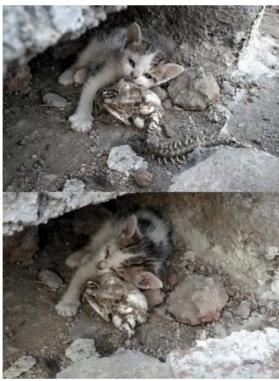
Чітніше зображення станом на 2019 рік, яке мали змогу знайти через сервіс TinEye

Надія Пущарьова, кандидат біологічних наук, надала коментар щодо того, чи збігається текст посту із фото: «З багажу курсу із зоології йому сказати, що це справді залишки котось із котички, найбільш ймовірно kota. Але чи це мати кошечки – важко судити, адже звісно прив'язаність сунує, але вона більш заснована на впізнанні запаху. Не впевнена, що ступінь розкладання і час (запозити досить довго не працюють і також виникає інший процес гниття, розкладання) робить можливим впізнати запах мамки. Щодо ступені розкладання... Я б припустила, що тут має місце поїдання трупу, тому він виглядає саме так за короткий проміжок часу».