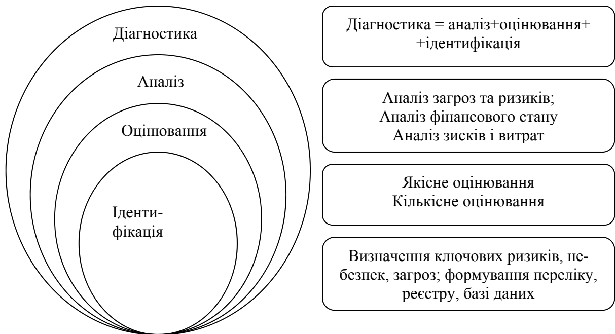
Рис. 1. Співвідношення між основними поняттями оцінювальної діяльності у сфері економічної безпеки агрохолдингу [4]

Важливо підкреслити, що одне із завдань діагностики полягає у визначенні ідентичності та нівелюванні диспропорцій процесів розвитку бізнес-процесів. Діагностика дозволяє виявити причинно-наслідкові зв'язки дисфункції менеджменту агрохолдингу, а потім переходити до побудови пояснювальної і прогнозної моделі його розвитку і функціонування.