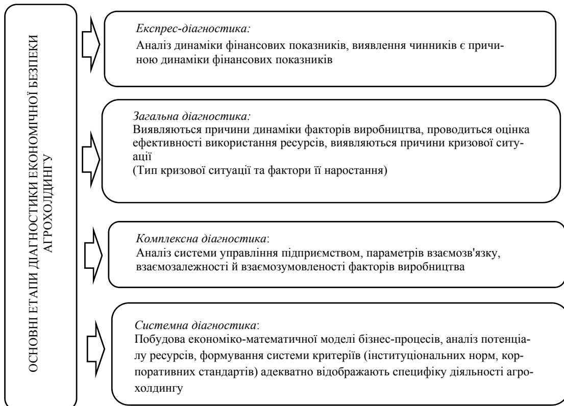
Рис. 3. Основні етапи діагностики стану економічної безпеки агрохолдингу [складено автором за 4,8]

ТОВ «Нібулон» є одним з найбільших українських виробників та експортерів сільськогосподарської продукції, інвестором в АПК. Підприємство було створено у грудні 1991 року як спільне українсько-угорсько-англійське сільськогосподарське підприємство «Нібулон» (ССП «Нібулон»), основним видом діяльності якого було виробництво та реалізація гібридного насіння кукурудзи та соняшнику закордонних селекцій. Основними напрямками діяльності ТОВ «Нібулон» є: виробництво та перероблення сільгосппродукції (аграрне виробництво); зберігання, доробка та перевалка зерна, торговельна діяльність; логістика; зовнішньоекономічна діяльність; суднобудування та судноремонт; тваринництво та подальша м'ясопереробка; додаткові послуги [16].