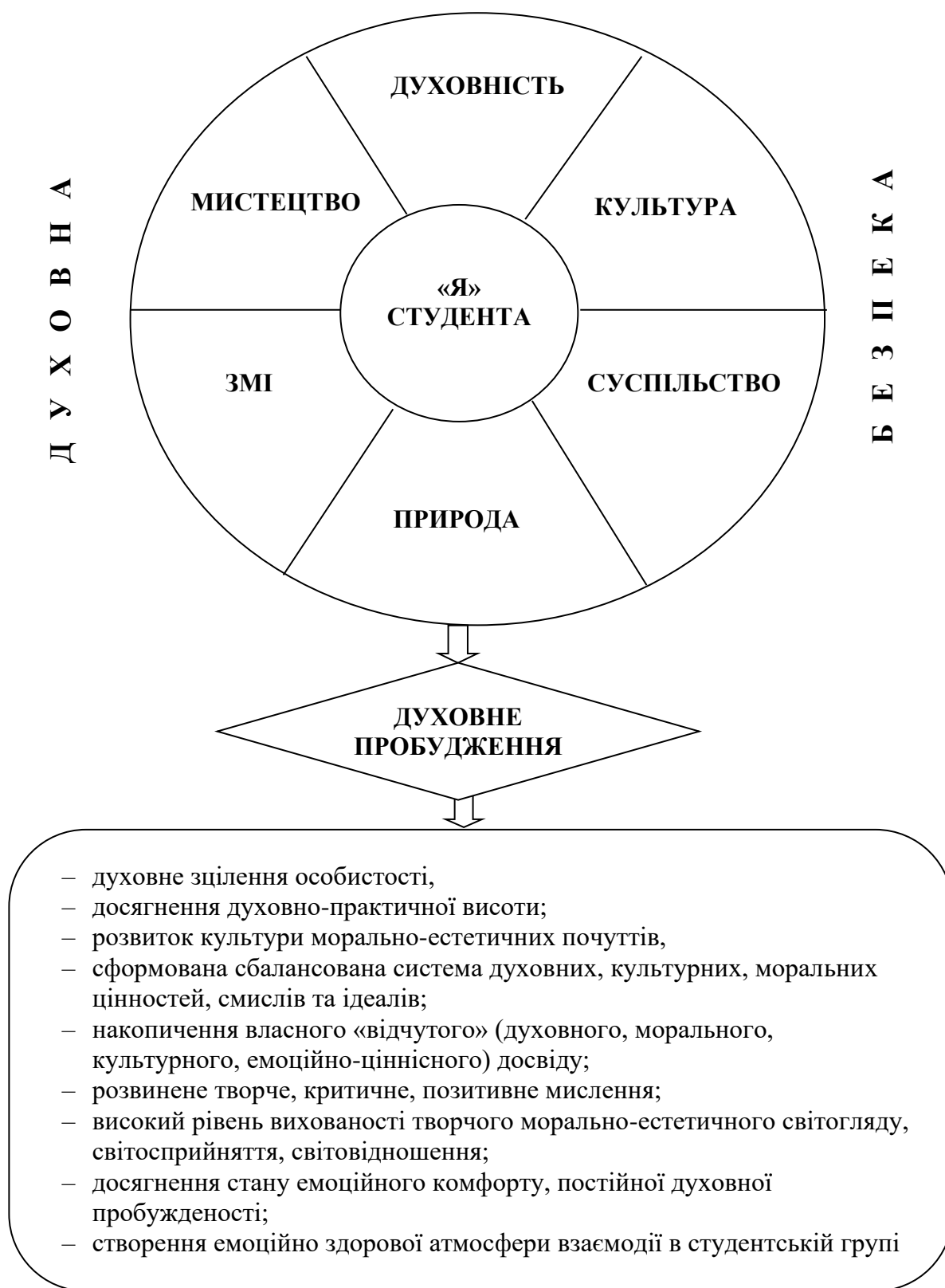
Рисунок 1.1 – Структурно-функціональна модель духовної безпеки студентської молоді